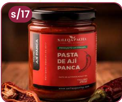
PASTA AJÍ PANCA POTE VIDRIO