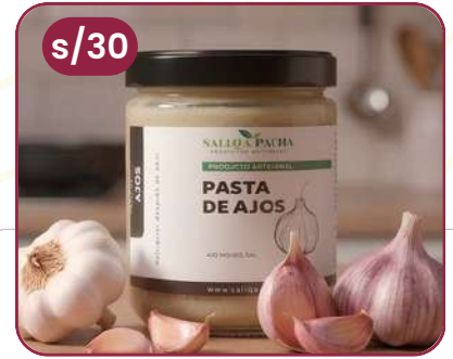
PASTA DE AJO POTE VIDRIO