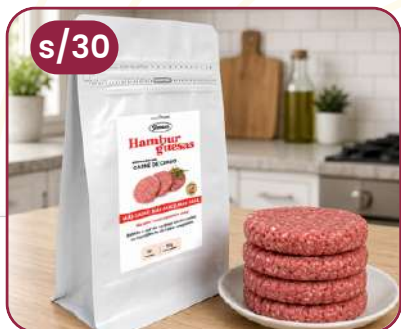
HAMBURGUESA DE CERDO 1 kg (8 unidades)