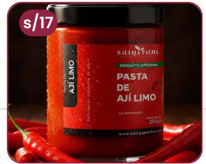
PASTA DE AJI LIMO POTE VIDRIO