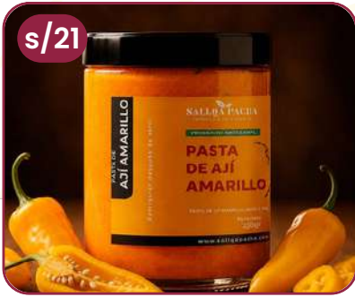
PASTA AJÍ AMARILLO, POTE VIDRIO