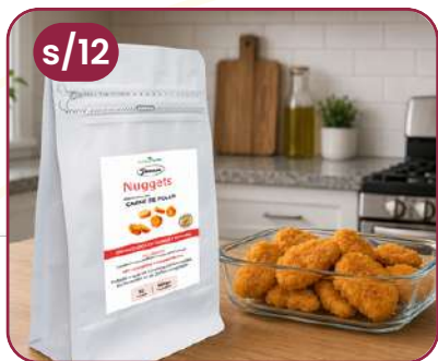
NUGGETS DE POLLO 15 unidades