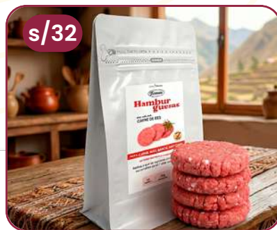
HAMBURGUESA DE RES 1 kg (8 unidades)