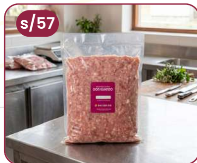
CARNE MOLIDA DE CUY La presentación es de 200gr