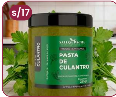
PASTA DE CULANTRO POTE VIDRIO