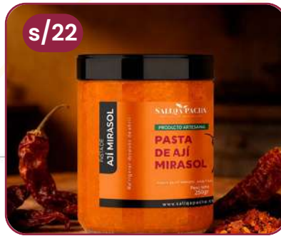
PASTA DE AJI MIRASOL POTE VIDRIO